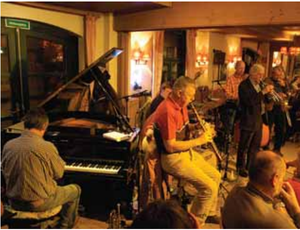
JAZZCIRCLE ROUTE @WÄRNER FRÖHLICH

Im Perchtoldsdorfer Klubraum des „Jazzcircle Route 66“, dessen Holzausstattung für eine hervorragende Akkustik sorgt, gibt es ausgezeichnete Live-Musik im 14-Tage-Rhythmus.